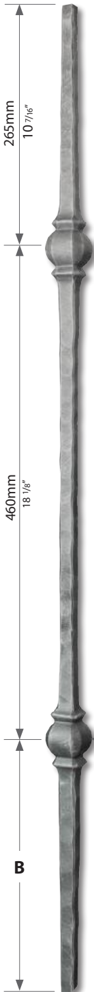
■ 10-13 mm 3/8-1/2" B 2102