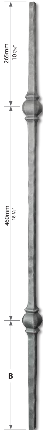
■ 10-13 mm 3/8-1/2" B 2003